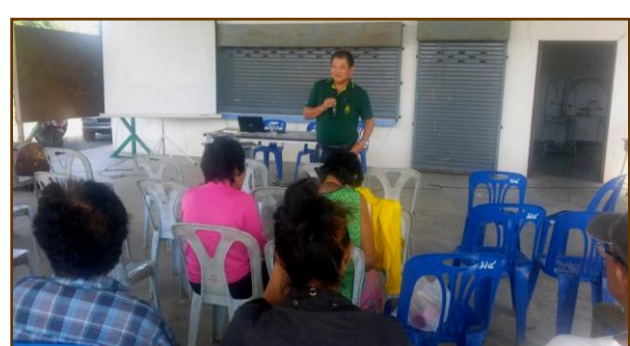
การใช้สารธรรมชาติในการป้องกัน และกำจัดศัตรูพืชในพืชผัก