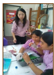
การตรวจสอบสารพิษ ตกค้างในผัก โดยใช้ชุดทดสอบ GT - Pesticide Test Kit