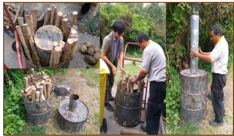
การเผาถ่าน ผลไม้