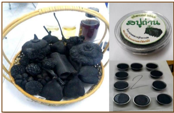
ผลิตภัณฑ์