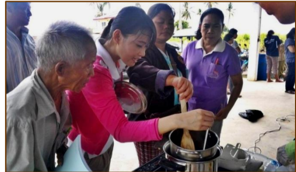
การแปรรูปถ่านเป็นผลิตภัณฑ์ชุมชน

ศูนย์ปฏิบัติการวิจัยและเรือนปลูกพืชทดลอง ศูนย์วิจัยและบริการวิชาการ คณะเกษตร กำแพงแสน มหาวิทยาลัยเกษตรศาสตร์ วิทยาเขตกำแพงแสน