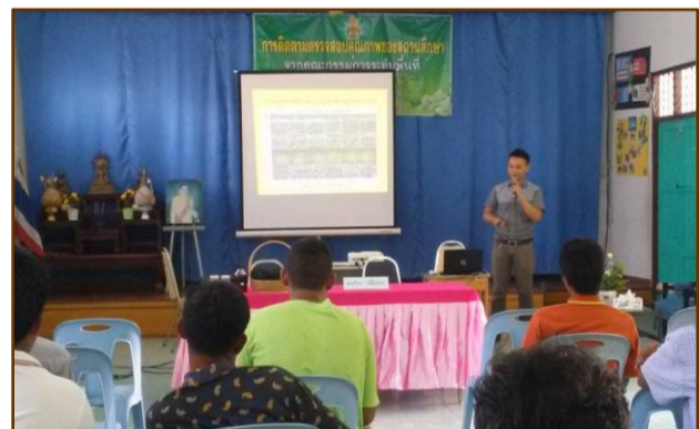
การใช้ประโยชน์จาก ถ่านในการปรับปรุงดิน