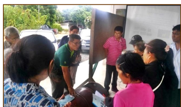
การสร้างเตาเผาถ่านจากถังโลหะ 200 ลิตร