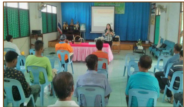
การใช้น้ำส้มควันไม้ ทางการเกษตร