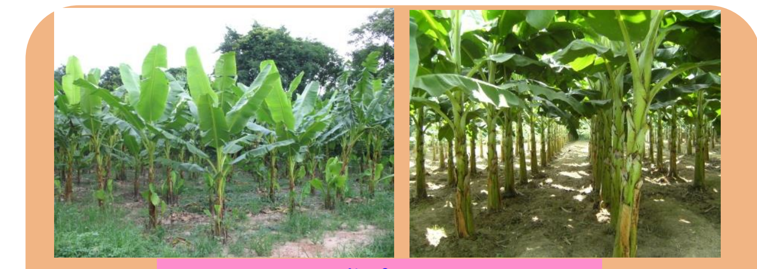
แปลงปลูกกล้วยในเชิงเศรษฐกิจ

กล้วยน้ำว้า ใช้ระยะปลูก 4x4 เมตร (100 ต้น/ไร่) ถ้าชิดเกินไปจะทำให้เกิดโรคและแมลงระบาดง่าย กล้วยหอมและกล้วยไข่ ใช้ระยะปลูก 2x2 เมตร (400 ต้น/ไร่) เนื่องจากไว้หน่อจากต้นแม่เพียงรุ่นเดียว)