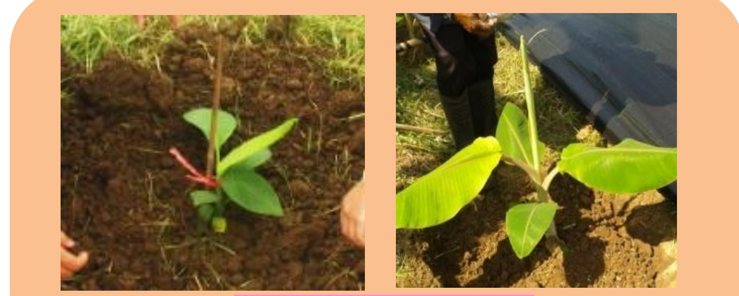
ต้นกล้าเพาะเลี้ยงเนื้อเยื่อ