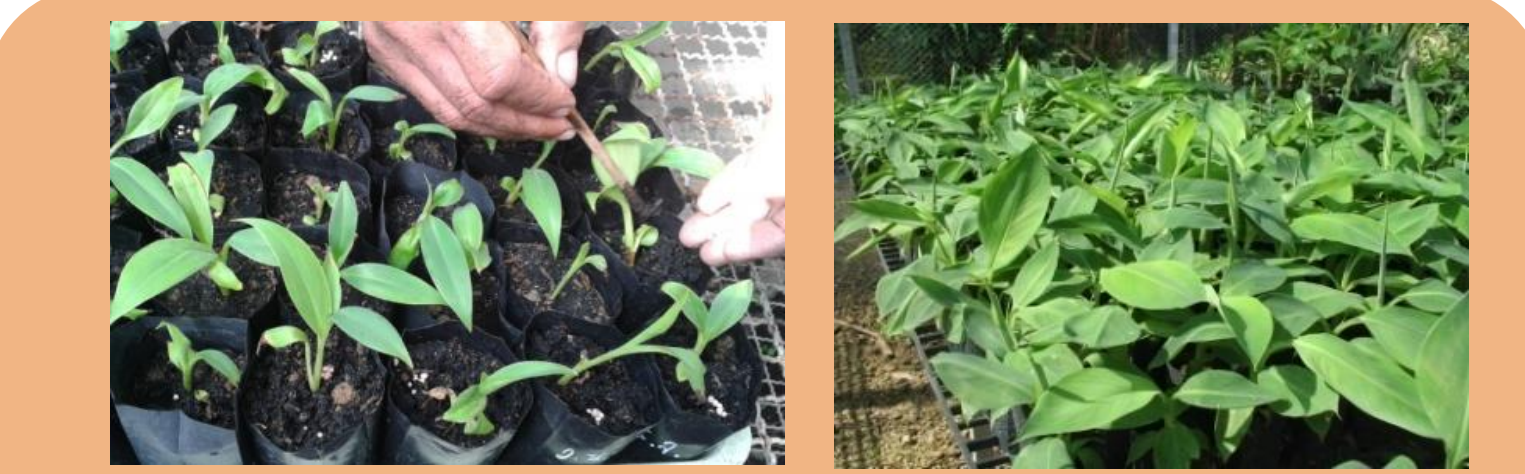
พรวนดินใส่ปุ๋ย ต้นกล้าพร้อมปลูกลงแปลง