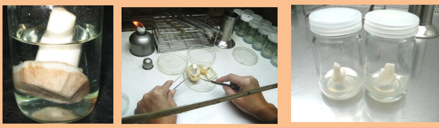
ฟอกฆ่าเชื้อในตู้ปลอดเชื้อ เลี้ยงในอาหารวิทยาศาสตร์