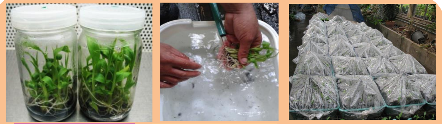
ชักนำให้ออกราก ล้างรุ้นออกจากราก อบต้นในถุงพลาสติก