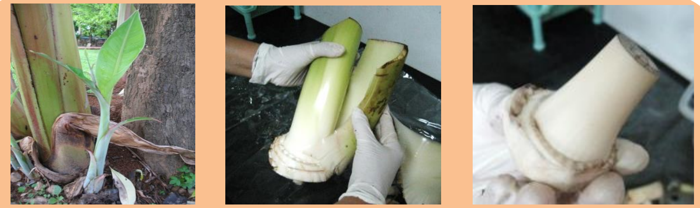
เลือกหน่อกล้วยใบดาบจากต้นที่ให้ผลผลิตสูงและปลอดโรค ลอกกาบใบจนถึงด้านในและล้างทำความสะอาด